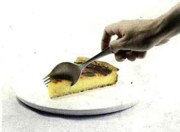
Fourchette, cuillère et couteau, la Georgette est un couvert qui sait tout faire (19,80 euros).