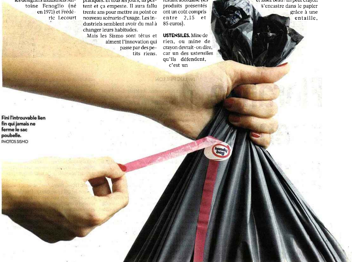
Fini l'introuvable lien fin qui jamais ne ferme le sac poubelle.

taille-crayon de la marque Galactic. Fini l'agacement quand on casse et coince sa mine dans ce petit outil d'écolier. Avec le Maped, la mine est éjectée automatiquement. Le tandem revient aussi sur son mug à thé Two, dessiné avec une encoche pour coincer le sachet et complété par une assiette pour récupérer ledit sachet mouillé. Ils ont encore à leur actif un cahier bloc-notes malin et assez beau : un petit crayon s'encastre dans le papier grâce à une entaille,